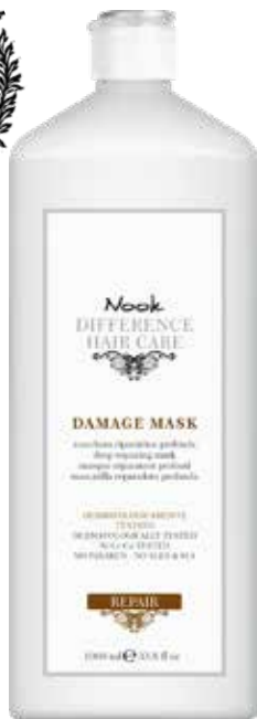
NK1000612 - 1000 ml 9 017 Ft

Kifejezetten közepes- és vastagszálú hajra. Ellensúlyozza a fejbőr és a haj kiszáradását. Helyreállítja és feltölti az igénybevett és sérült hajszerkezetet. Az antioxidáns hatás biztosítja a vegyileg kezelt haj védelmét és visszaadja rugalmasságát, megkönnyítve a kifésülést. Segít megelőzni a hajvégek töredezését; vitalitást, tónust, fényt és puhaságot ad a hajnak anélkül, hogy elnehezítené. Javasolt száraz fejbőrre, mely használatával visszanyeri rugalmasságát és hidratáltságát.