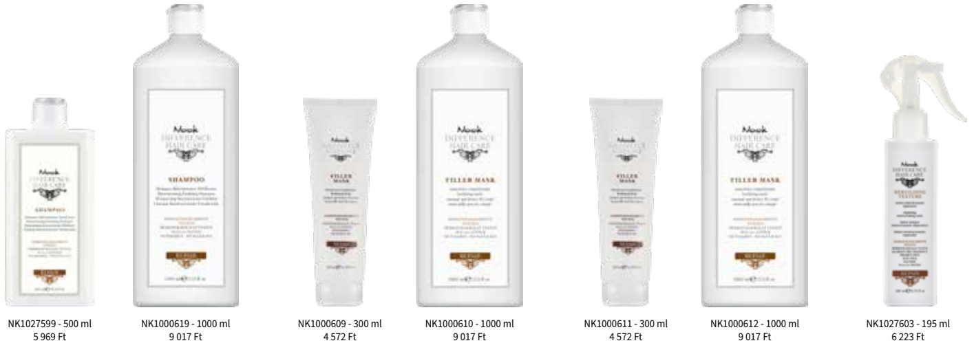
NK1027599 - 500 ml 5 969 Ft

Professzionális ápoló termékcsalád a gyenge, sérült és erősen igénybevett haj számára